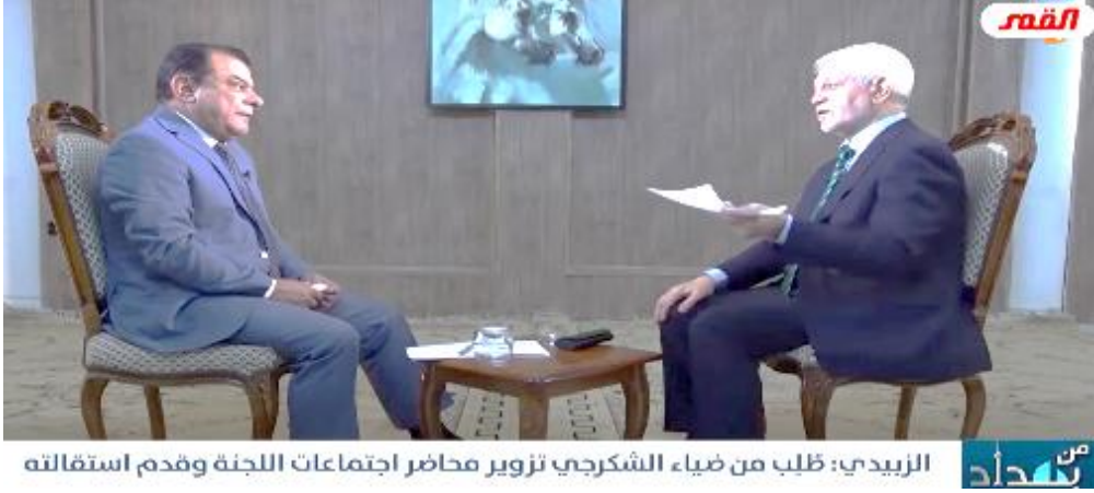
الزبيدي: طلب من ضياء الشكرجي تزوير محاضر اجتماعات اللجنة وقدم استقالته