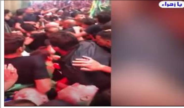
وإلى الفيديو الثالث